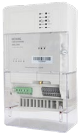
DC- Data Concentrator

Nedan följer ett urval av produkter som Bolaget tillhandahåller (läs gärna om dem i Bolagets Memorandum)