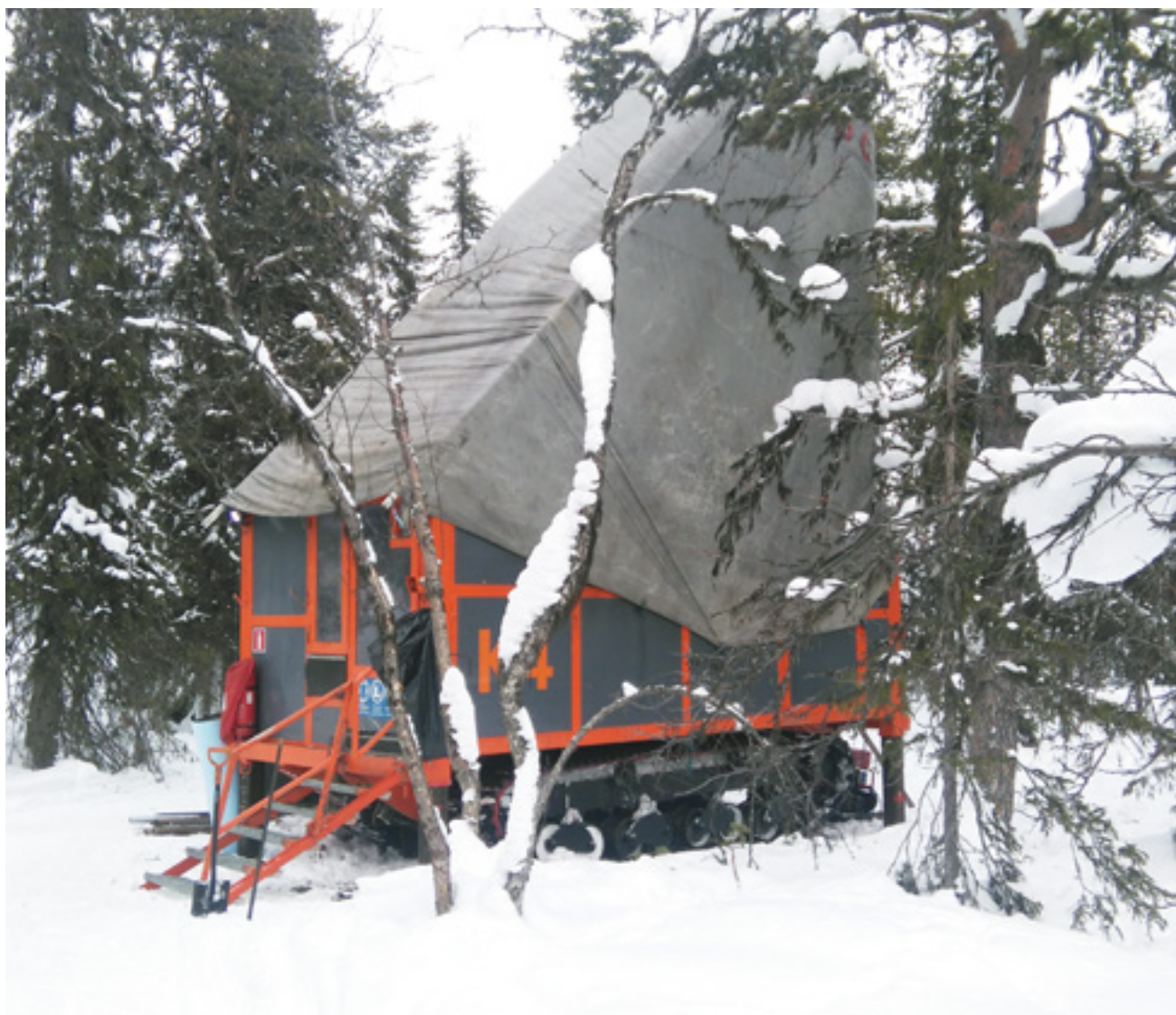
Kärnborrning i vinterlandskap av Arctic Minerals prospekteringsentreprenör ADC, Arctic Drilling Company.

Finland är idag geologiskt ett av de mest intressanta områdena globalt. Därtill är Finland ett politiskt stabilt land med en lång tradition inom den finska gruvnäringen. Det finns även en väl utvecklad infrastruktur kring gruvindustrin i Finland med god tillgång på entreprenörer och experter. I Arctic Minerals ledning och styrelse finns även en unik kunskap och erfarenhet av de geologiska och affärsmässiga förhållandena i Finland.