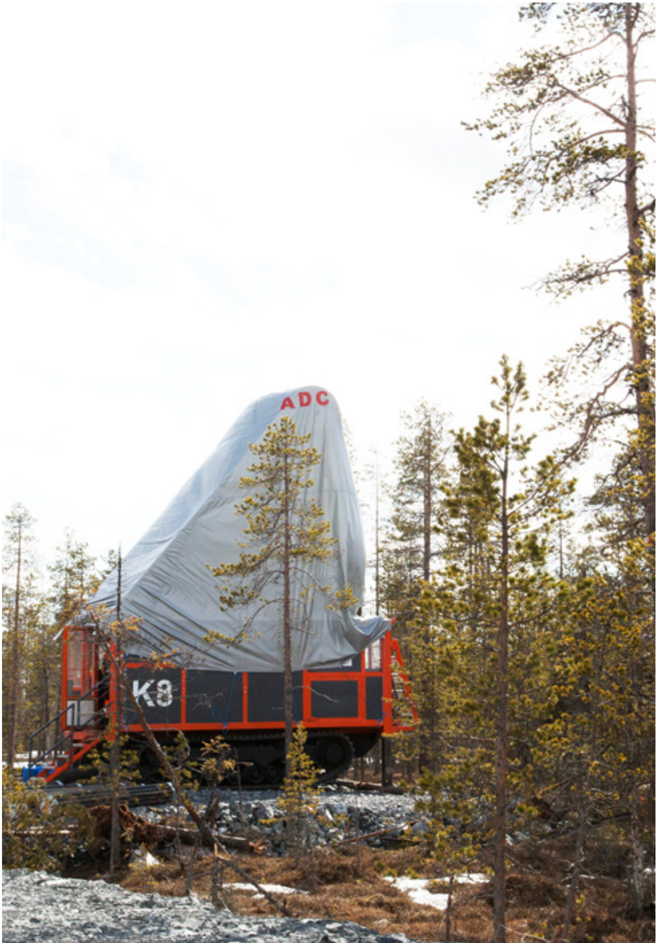
Kärnborrning av Arctic Minerals prospekteringsentreprenör ADC, Arctic Drilling Company.