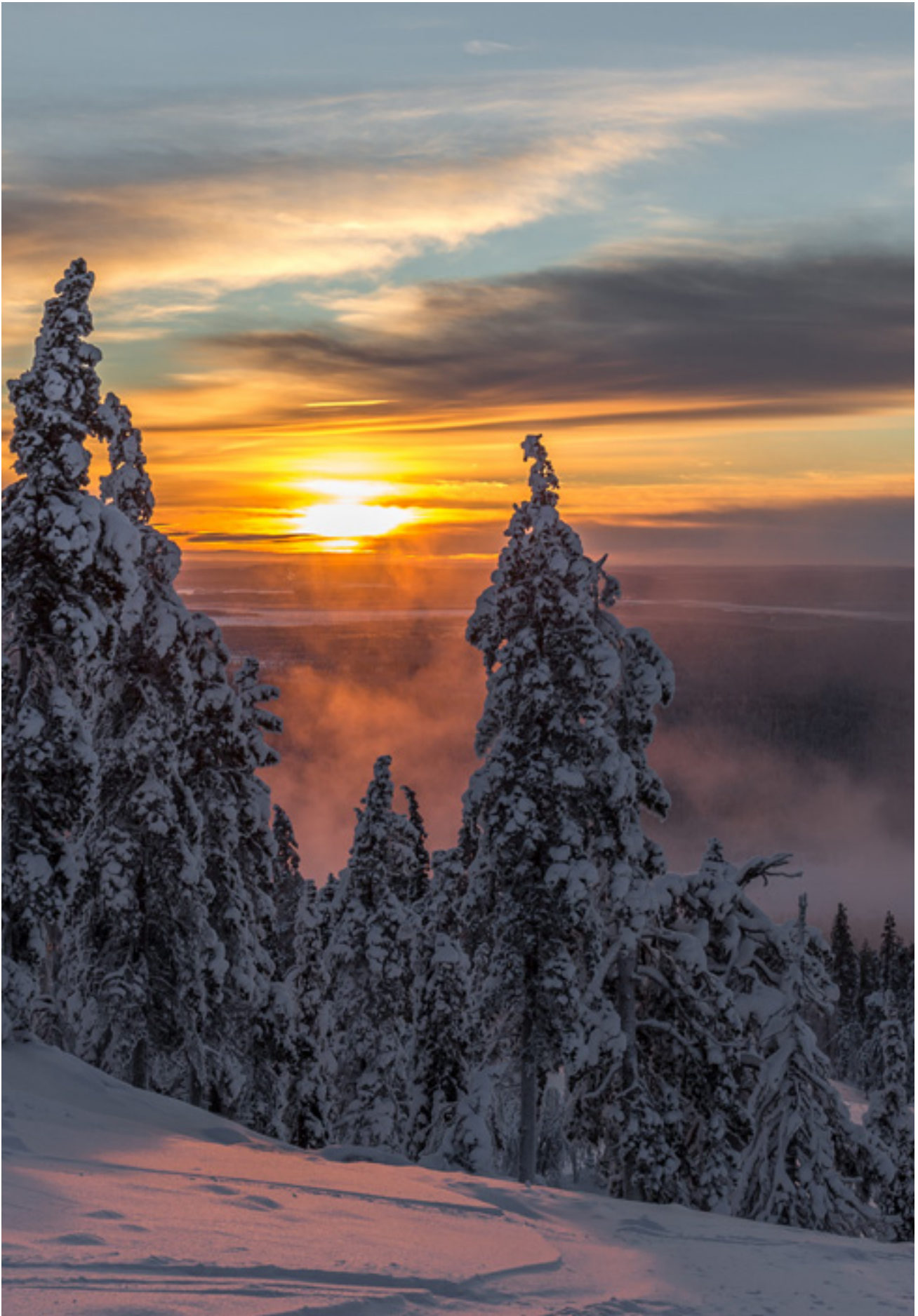
Finska Lappland.