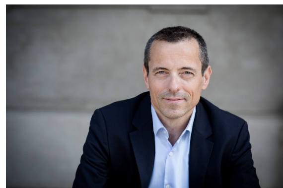
Verkställande direktör, Coegin Pharma AB

Vi ser mycket positivt på framtiden med en starkt pipeline och flera goda möjligheter för att skapa aktieägarvärde. Vår ambition är att vidareutveckla AVX001 gel som en säker och effektiv behandling av aktinisk keratos och basalcancers. Vi ser AVX420 som en mycket lovande läkemedelskandidat för både leukemi och kroniska njursjukdomar och arbetar mot att ta projektet fram mot klinisk utveckling. Vi ser intressanta möjligheter i Follicums unika peptidteknologi och expertis inom diabeteskomplikationer och målsättningen är att arbeta fram fler kliniska läkemedelskandidater med potential inom indikationer med ett stort medicinskt behov. Avslutningsvis vill jag meddela att vi återkommer med en statusuppdatering efter att resultaten för COAK-studien analyserats.