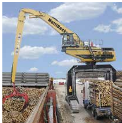
Maskin från MultiDockers Cargo Handling i arbete.

Utöver dessa utdelningar kunde Dividend Sweden erbjuda sina aktieägare att teckna aktier i Swemet och Nickel Mountain Resources. Båda bolagen är spännande och har goda möjligheter att utvecklas väl på börsen.