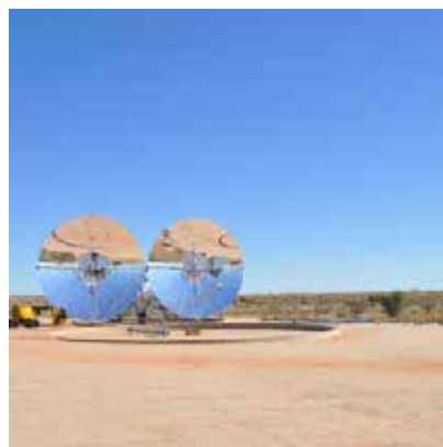
Ripasso Energys solparaboler producerar el.