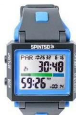
Spintso Ref Watch2X