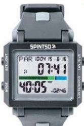
Spintso Ref Watch2S