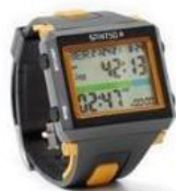
Spintso Ref Watch Pro