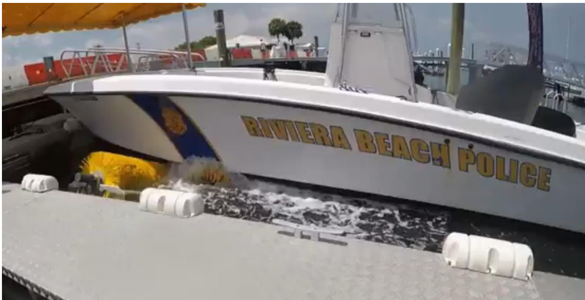
Tvätt av polisbåt i Florida, USA

Ingen av styrelsemedlemmarna eller de ledande befattningshavarna har dömts i något bedrägerirelaterat mål, konkursförvaltning eller likvidation i egenskap av styrelsemedlem eller ledande befattningshavare, varit utsatt för officiella anklagelser eller sanktioner av övervakande eller lagstiftande myndigheter och ingen av dessa har av domstol förbjudits att agera som ledamot i styrelse eller ledande befattningshavare eller att på annat sätt idka näringsverksamhet de senaste 5 åren.