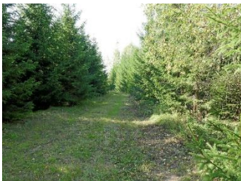
Mycket av skogen i Lettland finns på omställd åkermark, och tillväxten är hög.

Efter besked om att se över förutsättningarna för att tidigarelägga försäljningen steg Skogsfond Baltikums aktie med 4 procent, sedan starten sommaren 2019 har kursen gått upp med 65 procent.