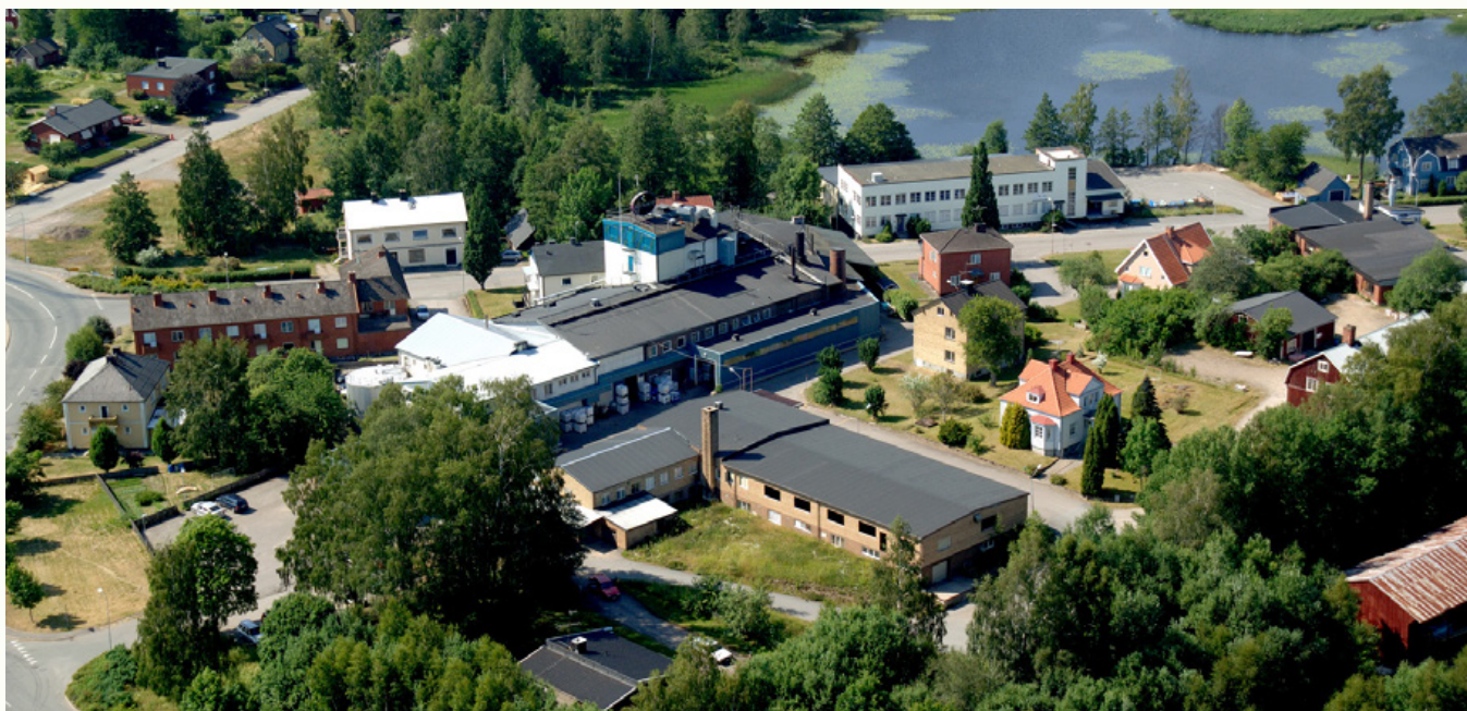
Bolagets fabrik i Rörvik

” North Chemicals värdering: 60 MSEK (pre-money) ”